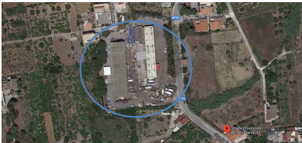
b) C.C.R. ex mattatoio comunale – Viale S. Isidoro.