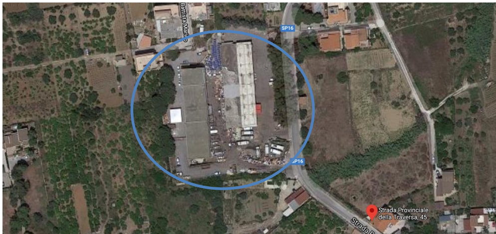
b) Ecopunto ubicato in contrada Lanzirotti